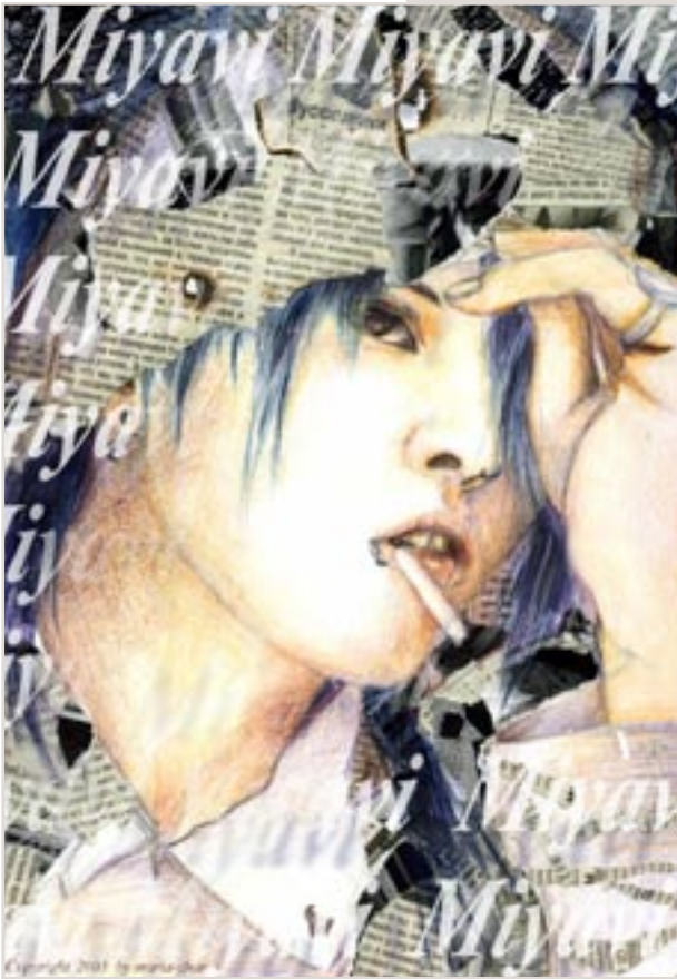
MIYAVI FOR NEKOKO